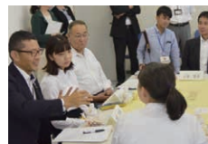
学生との意見交換会