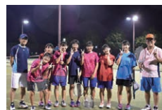
ソフトテニス指導