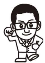
政治に参加しよう！

事務所 〒444-8522 岡崎市矢作町字出口1番地 東し労組内 TEL:0564-34-2514 FAX:0564-34-2517 自宅 〒444-0931岡崎市大和町字塗御堂24-6 TEL:070-5253-4192 FAX:32-4192 E-mail : yimacchi@m5.catvmics.ne.jp ブログ: http://ameblo.jp/iimachi-imachi/